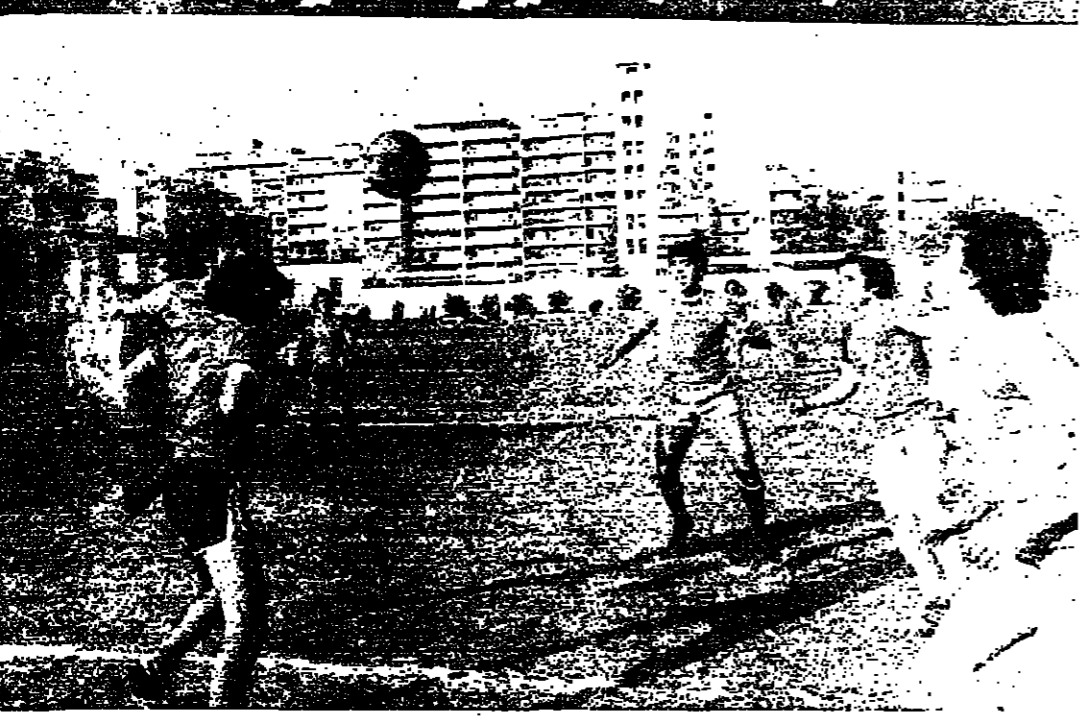
جرت بعد ظهر امس على الملعب البلدي في بيروت مباراة حية بين منتخب الطرس الجديدة ومنتخب النجمة .